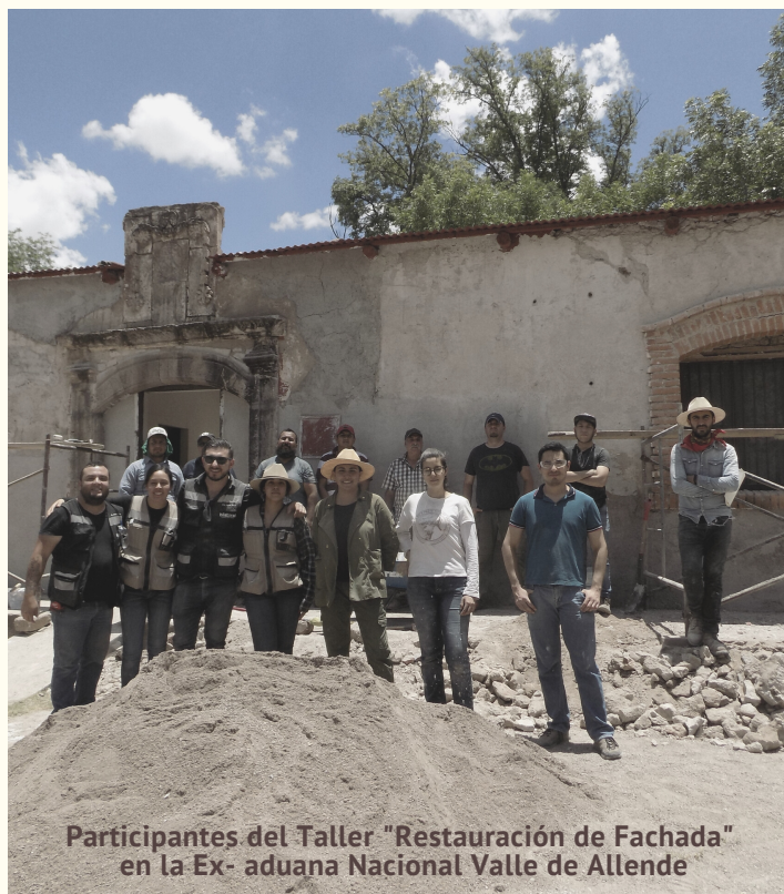
Participantes del Taller "Restauración de Fachada" en la Ex- aduana Nacional Valle de Allende