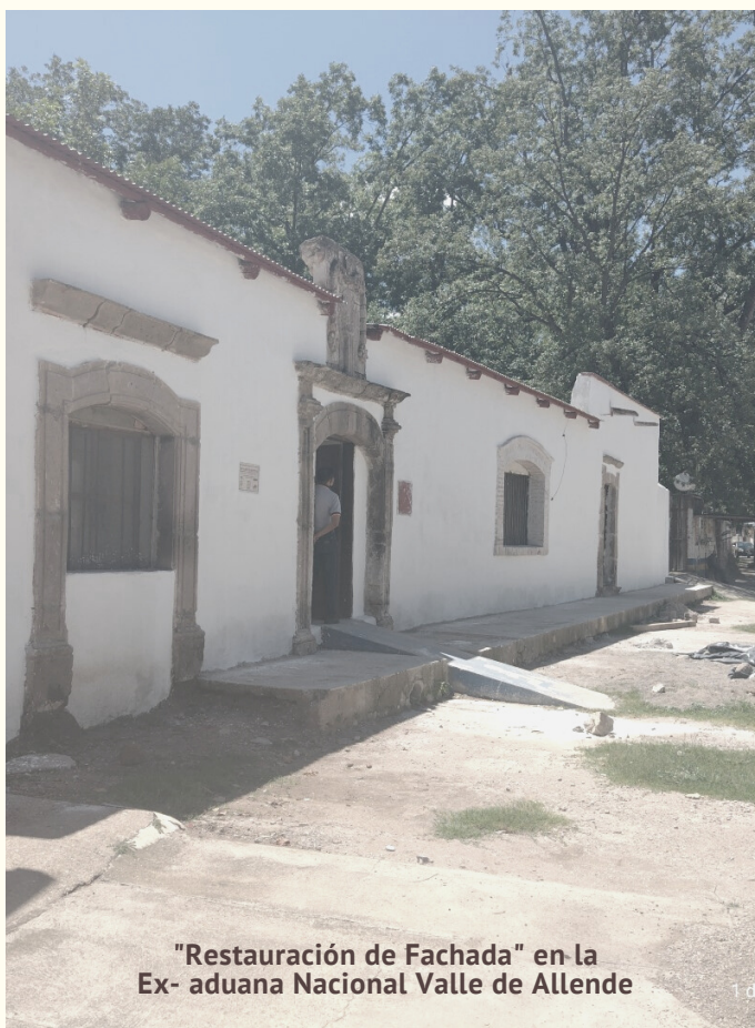
"Restauración de Fachada" en la Ex- aduana Nacional Valle de Allende