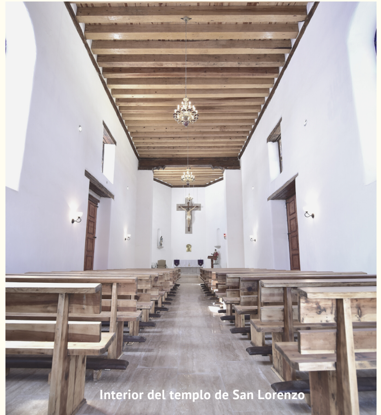
Interior del templo de San Lorenzo