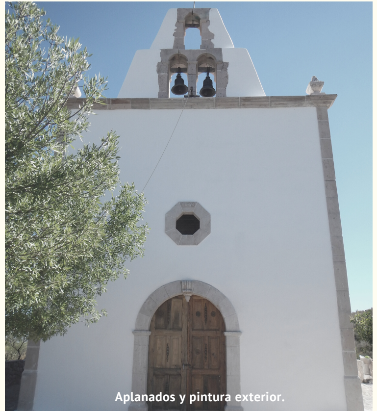
Aplanados y pintura exterior.