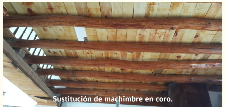
Sustitución de machimbre en coro.