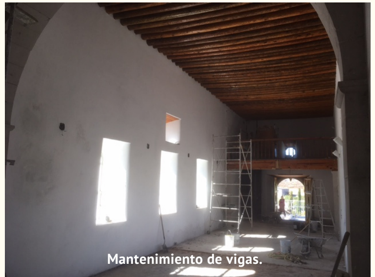
Mantenimiento de vigas.