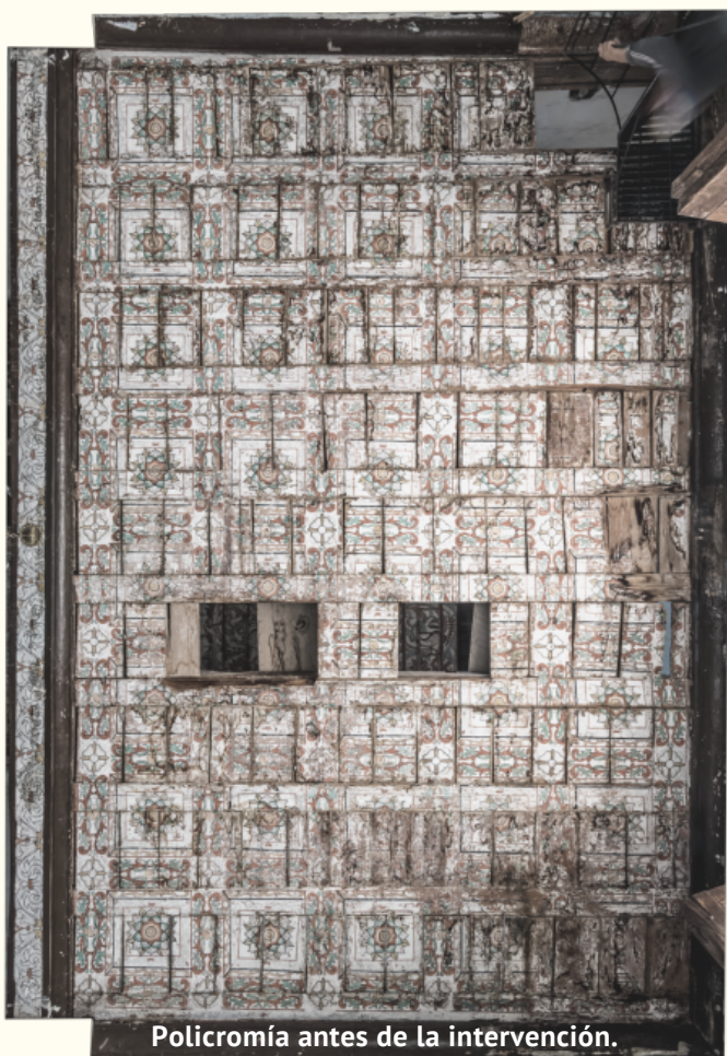
Policromía antes de la intervención.