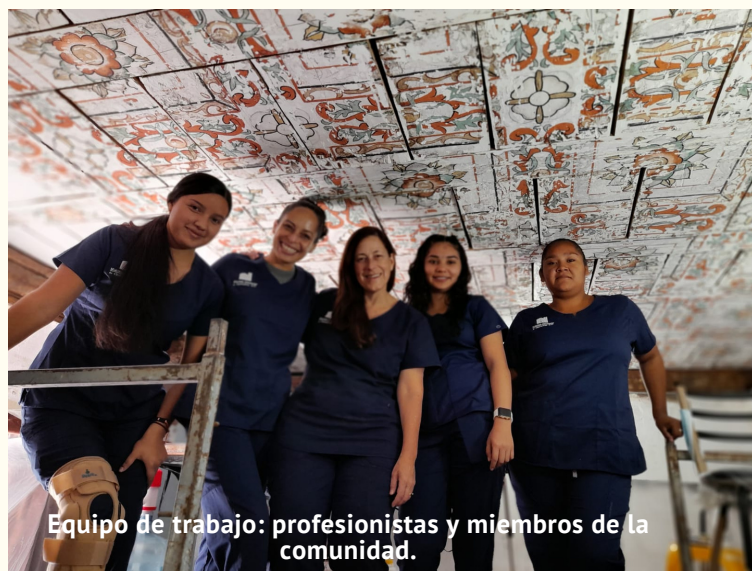
Equipo de trabajo: profesionistas y miembros de la comunidad.