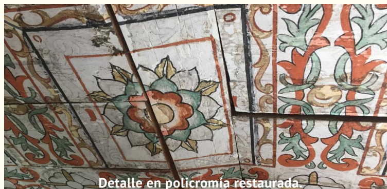
Detalle en policromía restaurada.

"TRABAJAMOS PARA SALVAGUARDAR EL PATRIMONIO CULTURAL DE NUESTRO ESTADO EN BENEFICIO DE LAS COMUNIDADES"