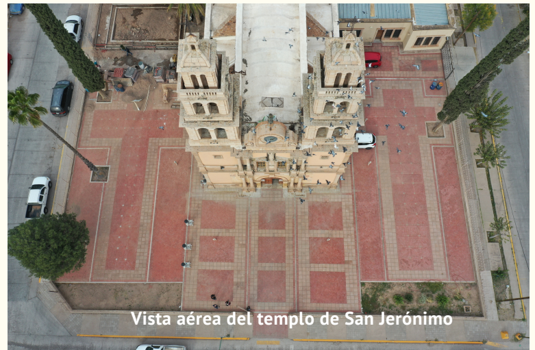
Vista aérea del templo de San Jerónimo