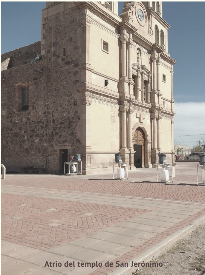
Atrio del templo de San Jerónimo