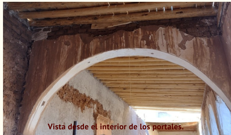
Vista desde el interior de los portales.