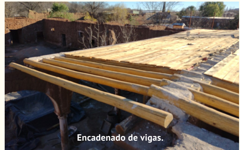
Encadenado de vigas.