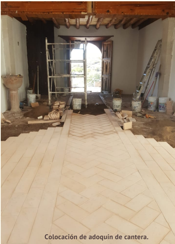
Colocación de adoquín de cantera.