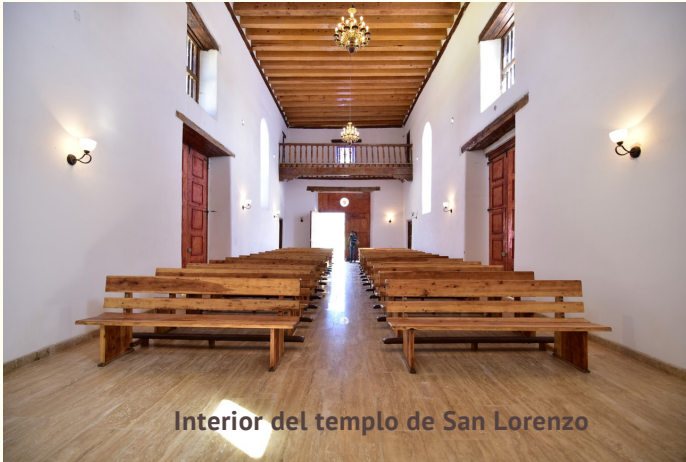
Interior del templo de San Lorenzo